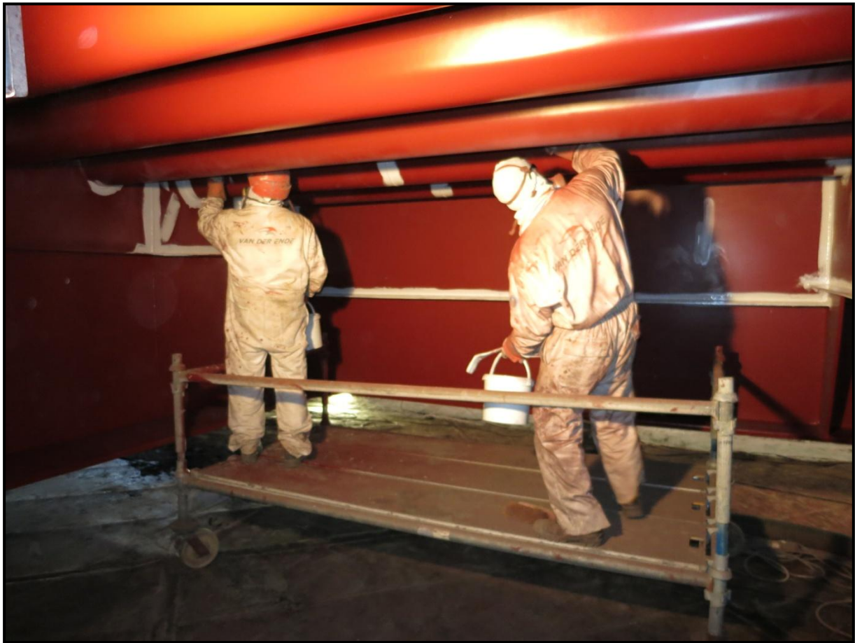
Foto: Onze mensen zijn bezig met het schilderwerk aan de onderzijde van de brug (fase 1)