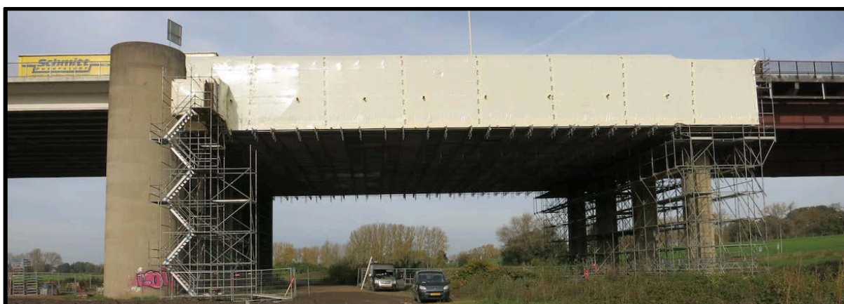
Foto: In januari is het eerste brugdeel helemaal opgeknapt en voorzien van een verflaag

In december hebben we flink kunnen doorwerken aan de conservering van het eerste brugdeel over de Halstraat. In de maand januari kunnen we de eerste fase geheel afronden. Dan breken we ook de steigerconstructie af. Dit onderdeel is volgens planning verlopen.